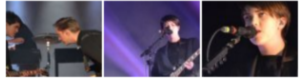
Night + Day na Torre de Belém: A dança dos The xx em Lisboa