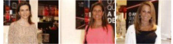
Cocktail de lançamento da gama Revitalift Laser X3 de L'Oréal Paris